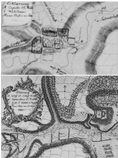
Affaltern und Markt um 1750

Die Dörfer der Gemeinde Biberbach weisen ganz unterschiedliche Siedlungsformen auf. Während sich Markt entlang der Straße zieht, besitzt Affaltern einen runden Siedlungskern. Klar erkennbar ist dies an den Karten, die Johann Lambert Kolleffel um 1750 anfertigte. Diese Strukturen sind historisch überliefert und bis in die heutige Zeit fassbar. Die Unterschiede lassen sich auf die geographische Lage der Dörfer zurückführen. Affaltern entstand am Zusammenfluss von Biberbach, Leiseweiherbach und Reichertsgraben, die Siedlung konzentrierte sich zwischen den umliegenden Hügeln Buchberg, Forstberg und Pfaffenberg. Dort entwickelte sich ein Ortskern – und als in Affaltern gegen Ende des 17. Jahrhunderts eine Pfarrkirche gebaut wurde, war kein zentraler Platz mehr verfügbar. Daher wurde sie an der Straße nach Biberbach errichtet. Aufgrund der unregelmäßigen Grundstücksgrundrisse wird diese Siedlungsform „Haufendorf“ genannt. In Markt hingegen war die Straße das bestimmende Element bei der Siedlungsentwicklung. Diese verläuft bis heute vor den Abhängen unterhalb des Burgbergs und nördlich des Dorfbachs. Eine Expansion war für die Siedlung nur entlang der Straße möglich, weshalb Markt bis heute seinen langgezogenen Charakter als Straßendorf erhalten hat.