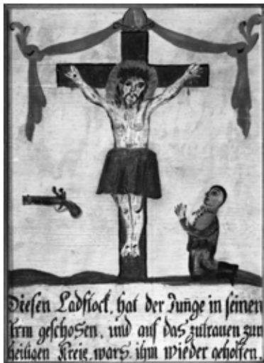
Votivtafel in der Biberbacher Wallfahrtskirche